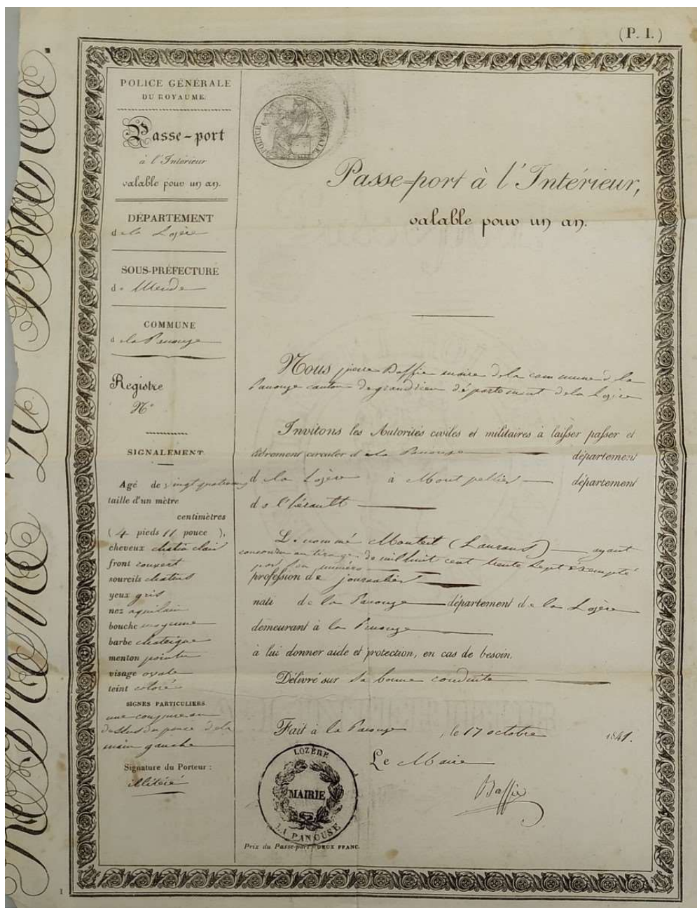
Passeport pour l'intérieur, 1841 (214)