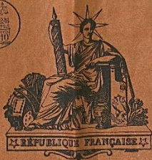
Affiche d'adjudication pour la construction de l'école, 1899 (4M1)