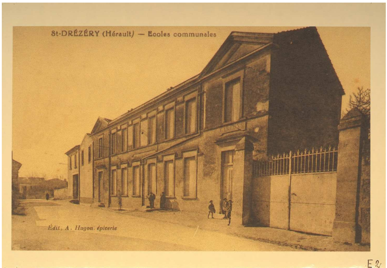
Vues du village sur cartes postales, début XX ème siècle (C1)