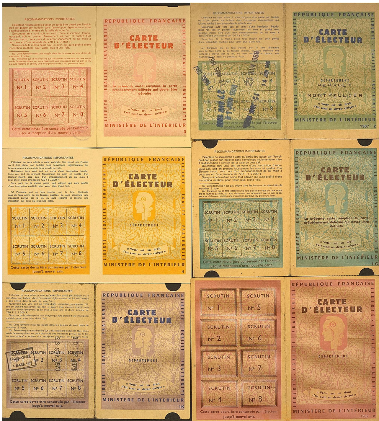
Échantillonnage de cartes électorales, années 1960-1980 (1K1)